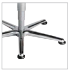
Aluminium- fußkreuz poliert