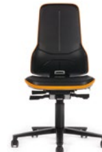
Neon 2 mit Rollen Sitzhöhe 450–620 mm