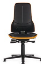
Neon 1 mit Gleiter Sitzhöhe 450–620 mm