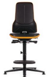
Neon 3 hoch mit Aufstiegs- hilfe und Gleiter Sitzhöhe 590–870 mm